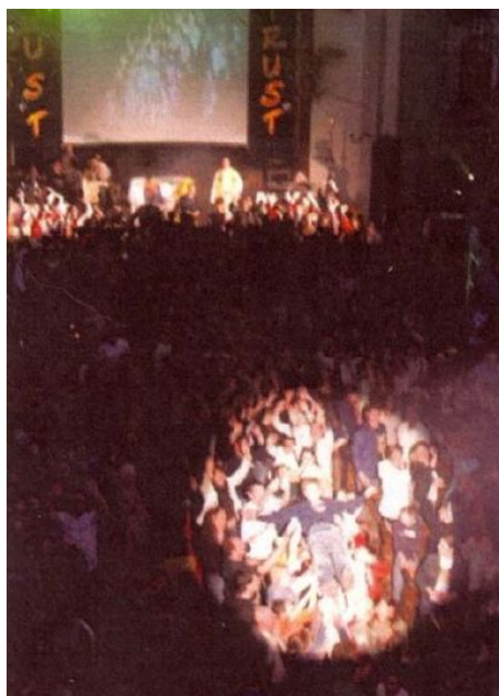
FIGURE 25.4 – Marée humaine à la Nouvelle Messe

Voilà pourquoi on entend parler de toutes sortes d'abomination dans la Nouvelle Messe, par exemple des messes de clowns, des messes polka, des messes pour enfants, etc., etc., etc., etc., dont la finalité commune est de rendre le culte conforme à l'assemblée — conforme à l'homme, qui est vraiment l'objet de son culte.